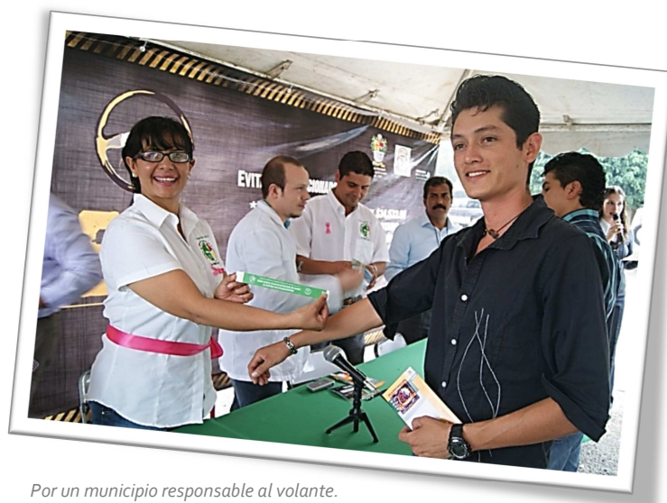
Por un municipio responsable al volante.

De igual manera el alcoholímetro estará realizándose en diversos puntos de la ciudad los días de mayor afluencia de la población, así como en eventos masivos y fines de semana; este operativo es permanente durante todo el año y solo en octubre se intensifica su aplicación.