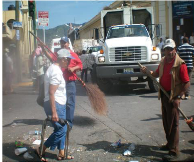
Limpieza y recolección de basura en diferentes áreas y calles de la ciudad.