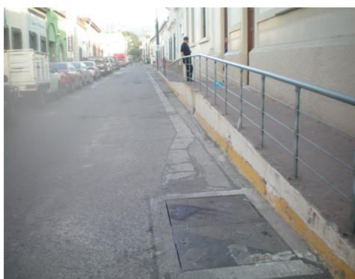
Limpieza y recolección de basura en diferentes áreas y calles de la ciudad.