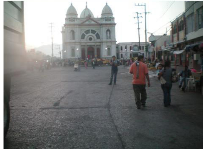
Limpieza y recolección de basura en diferentes áreas y calles de la ciudad.