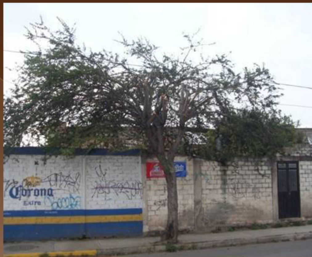
PODA CON PELICANO EN LA CALLE GREGORIO TORRES QUINTERO