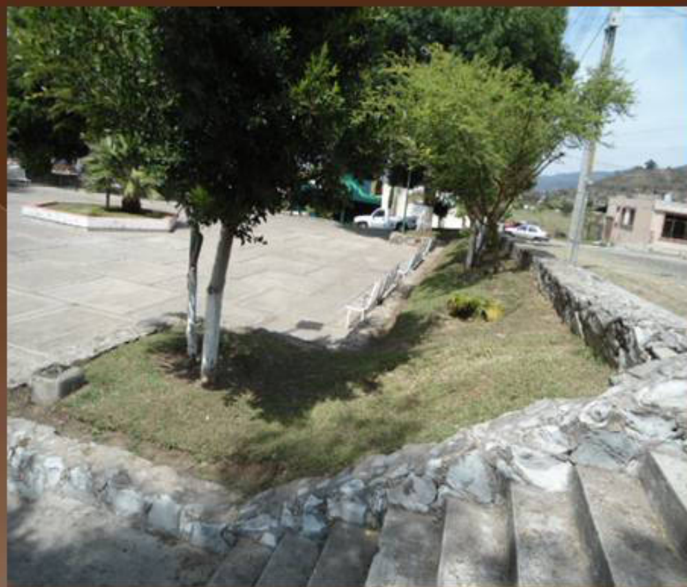
PODA DE PASTO EN LA PLAZOLETA DE LA COL. SAN CAYETANO