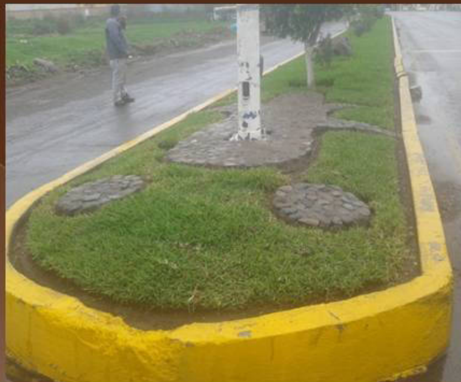
MANTENIMIENTO DE CAMELLÓN INGRESO PONIENTE