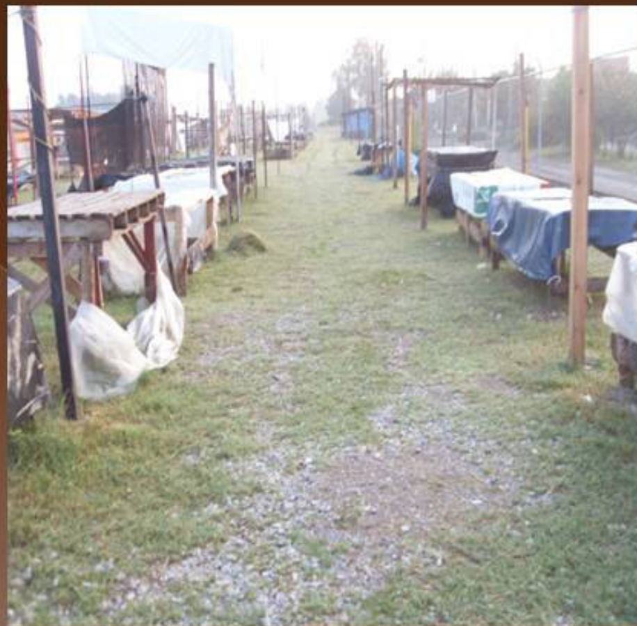
PODA DE PASTO TIANGUIS LAS PULGUITAS