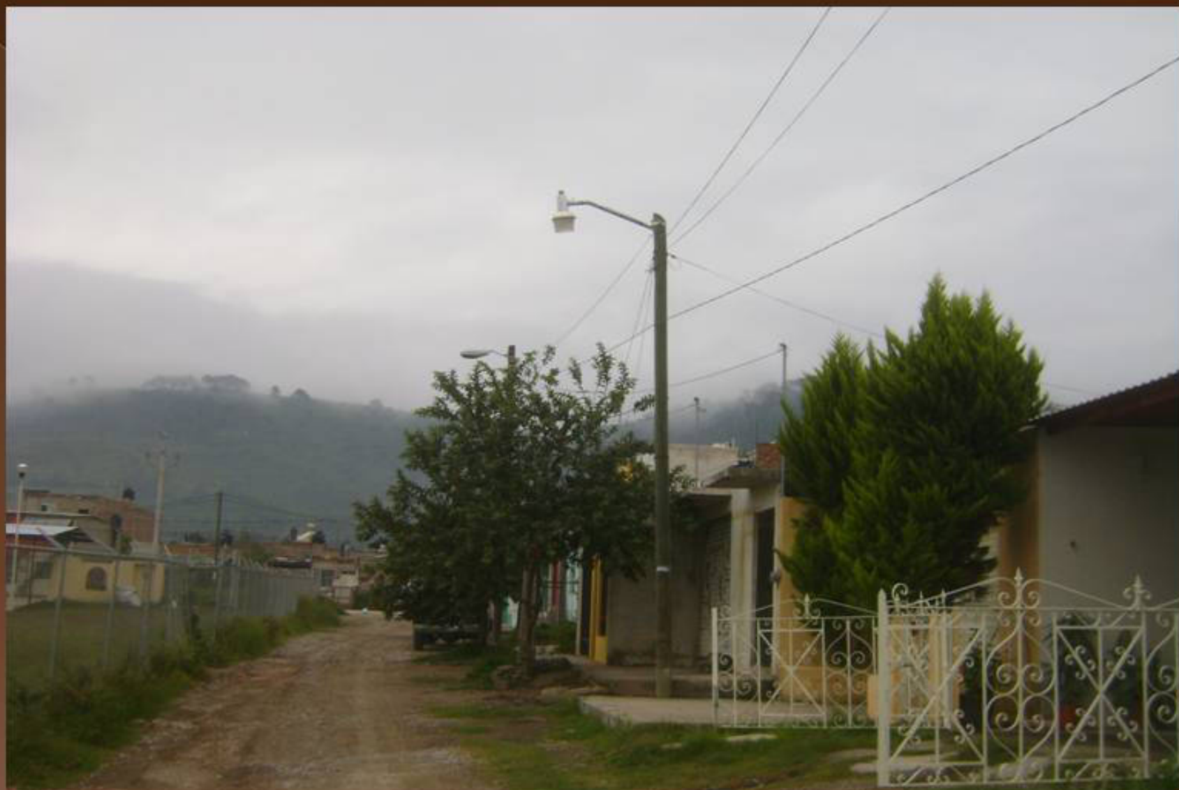
COLOCACION DE LÁMPARA EN CALLE LAURA DE APODACA # 6