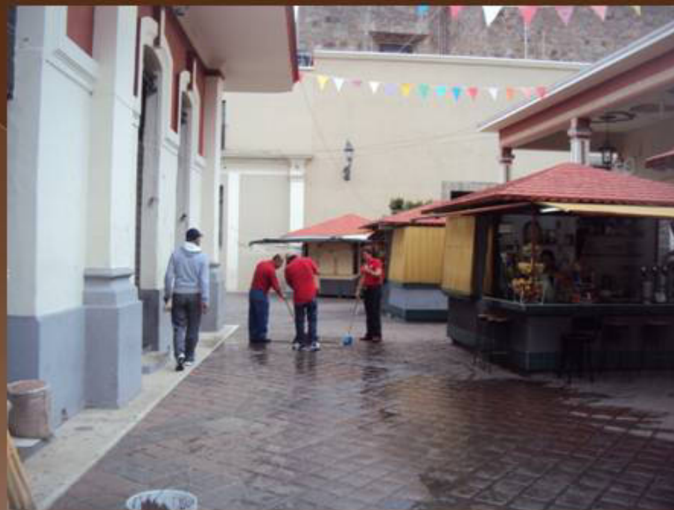
LAVADO DE ANDADORES EN EL ÁREA DE LOS KIOSKOS