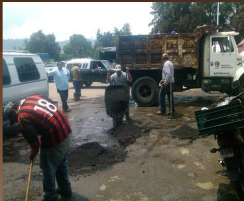
BACHEO EN EL ESTACIONAMIENTO DEL TIANGUIS MUNICIPAL