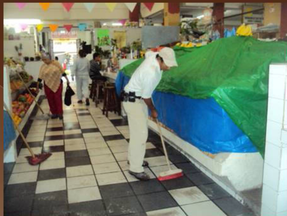
LIMPIEZA DE MERCADO "PAULINO NAVARRO"