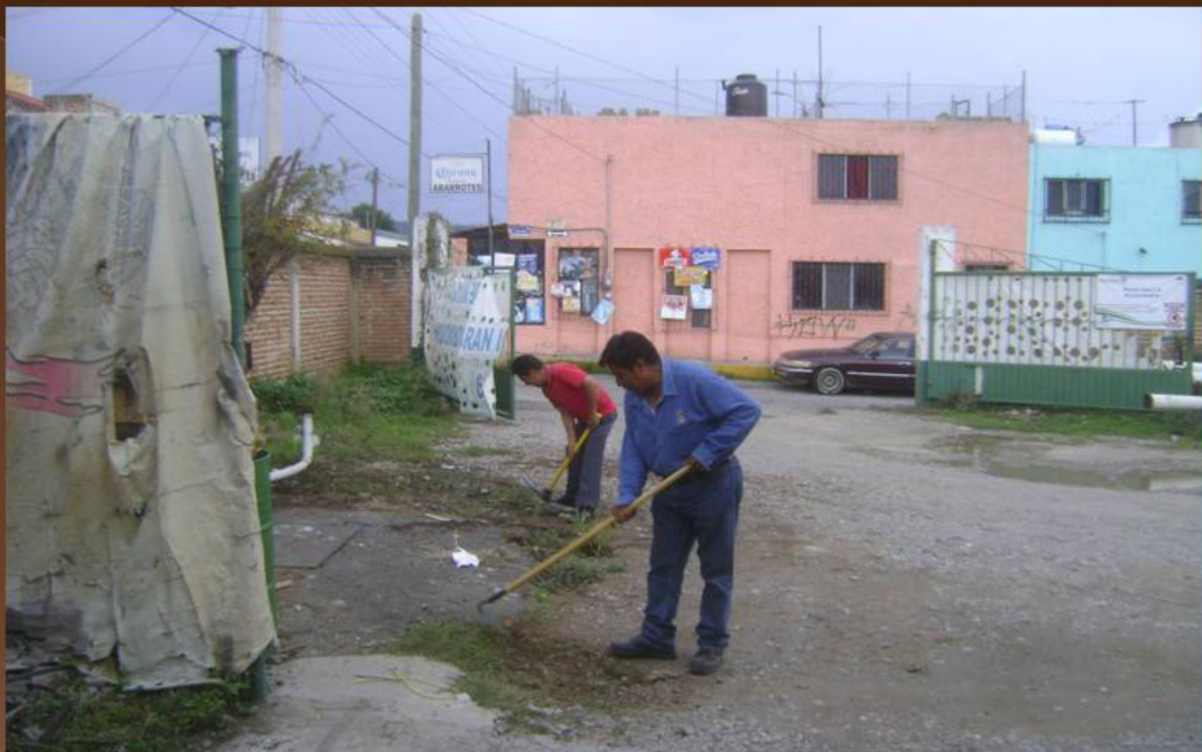
LIMPIEZA DE ÁREA EN EL POZO MUERTO