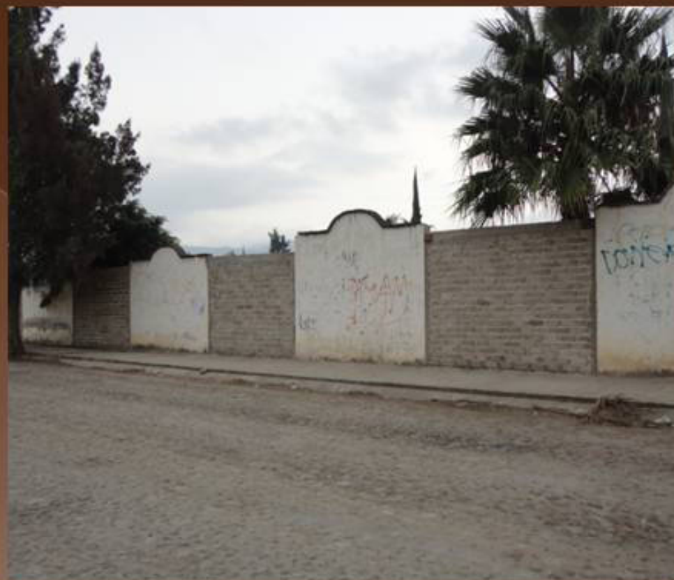
REMODELACIÓN DE MURO EN EL CEMENTERIO MUNICIPAL