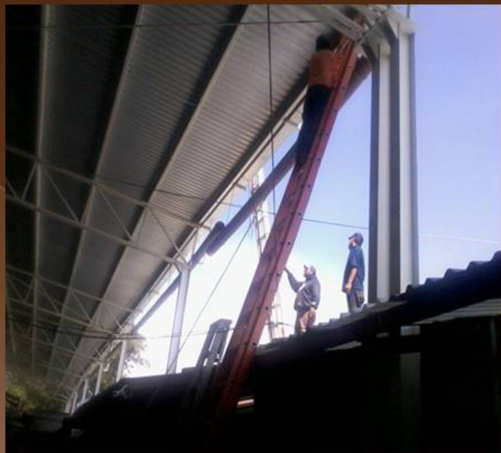
REMODELACIÓN DE DOMO EN EL TIANGUIS MUNICIPAL