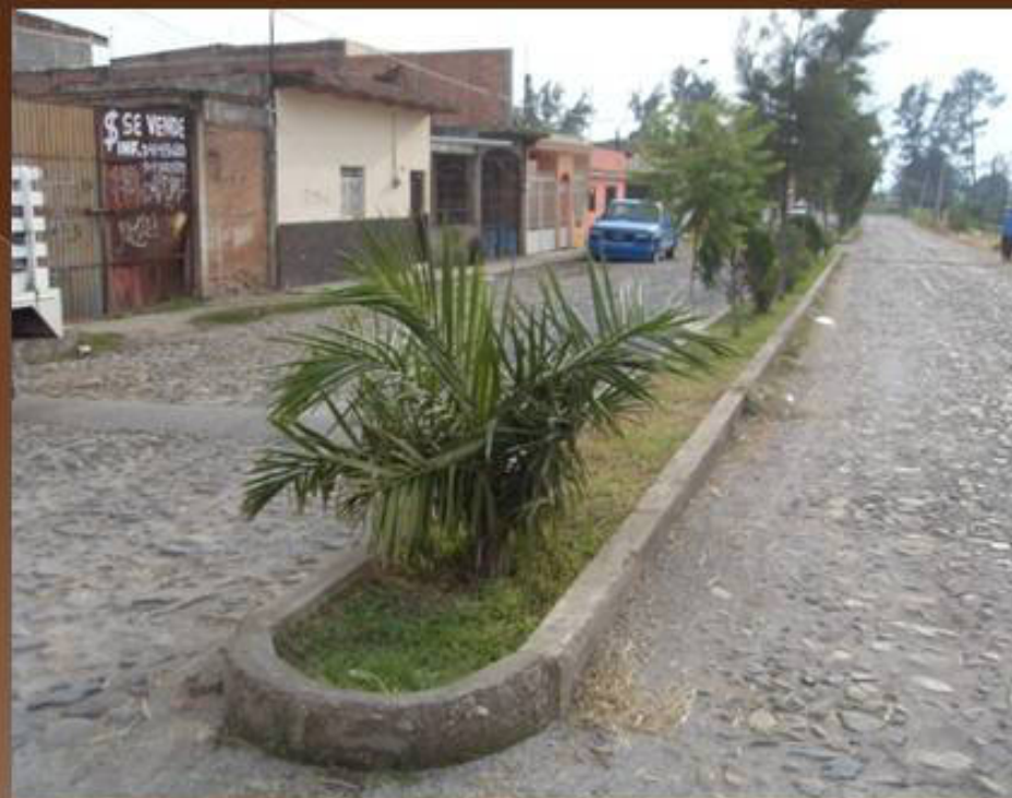
PODA DE PASTO EN EL CAMELLON DE LA COL. MORELOS