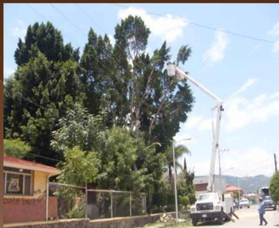
PODA DE ARBOL EN LA COL. SAN PEDRO, CALLE PINO