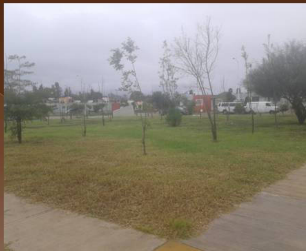
PODA DE PASTO EN LA COL. SAN FELIPE 2